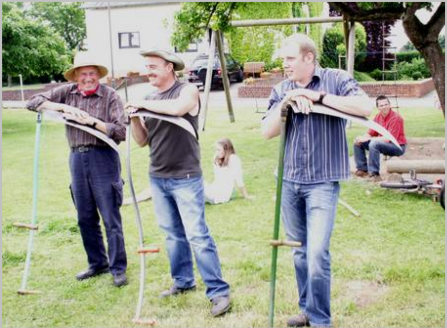
Die Erstplatzierten beim Sensenturnier 2009